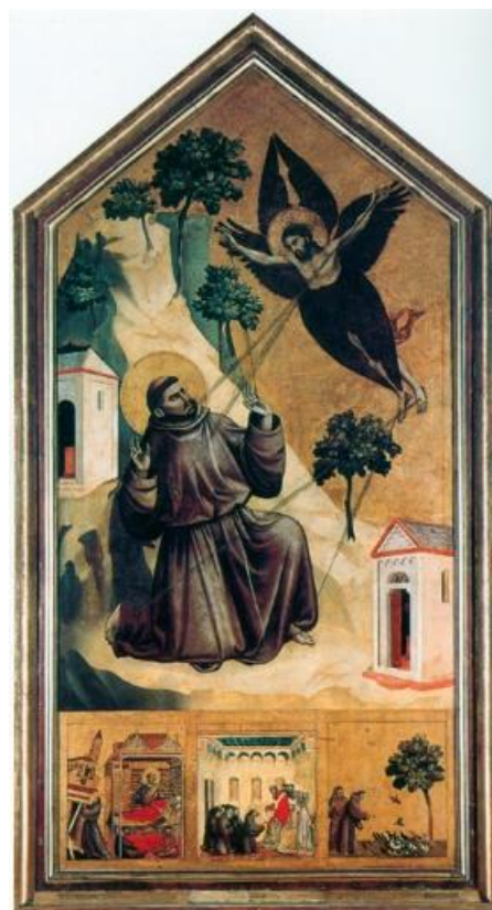
3. ábra. Giotto. 1300 k. Paris, Louvre.

Frugoni téziseit sorra véve újra elemzi Cortonai Illés enciklikus levelét, Leó testvér Rubricáját és Celanói Tamás legendáját. Arra a következtetésre jut, hogy a Frugoni által feltételezett ellentmondások magyarázhatóak és kiküszöbölhetőek: Illés pontatlanságait érthetővé teszik a gyász megrendítő első pillanatai, Leó rubricájában a fogalmazás azt fejezi ki, hogy a szeráf-látomás és a stigmatizáció ugyanannak a „beneficium”-nak az egybefüggő két aspektusaként kerül említésre, és a stigmák „benyomatása” ( impressio ) testi és nem spirituális jelenségre utal. Az a tény pedig, hogy a Leóhoz köthető Assisi kompiláció nem említi a stigmákat a Verna-hegyi szeráf-látomás elbeszélésénél, nem bizonyítja azt, hogy Leó ezek létezését tagadta volna, hiszen később maga is beleírta a Rubricá -ba. Celanói Tamás legendáját pedig nem egyszerűen a két elsődleges tanúság összeegyeztetésének, hanem alapos konzultáció nyomán összeállított, számos eredeti adatot elsőként közlő eredeti forrásnak kell tekinteni. Az e három forrásban fellelhető egybecsengő adatokból kiderül, hogy Ferenc holttestén számos tanú láthatta a Krisztus stigmáihoz hasonló sebeket, és ezeket néhányan még életében is megpillanthatták – ennek alapján a stigmák létezésének tényét nem lehet kétségbe vonni. Egy másik kérdés, amire nem tudhatjuk a választ, az, hogy mi (vagy ki) ezeknek a sebeknek az oka, okozója – ezt csak maga Ferenc tudta volna elmondani, de ezt nem tette.