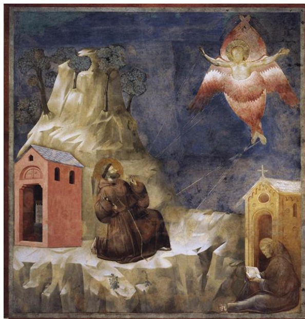
4. ábra. Giotto, 1320 k. Firenze, Santa Croce, Cappella Bardi

Jacques Dalarun után újra hozzászólt a stigma kérdéséhez André Vauchez , aki 2009-ben jelentette meg François d'Assise. Entre histoire et mémoire (Assisi Ferenc a történelem és az emlékezet között) című monográfiáját. Pontos és részletes leírást adott a stigmatizációval kapcsolatban fennmaradt források sokszínűségéről és egymás közti ellentmondásairól. Különös figyelmet szentel annak, hogy Bonaventura hogyan próbálta – szerinte sikerrel – feloldani ezeket az ellentmondásokat egy koherens krisztológiai értelmezésben, mely a Ferenc testén megjelenő stigmákat a látomásban megjelenő szeráf-Krisztussal való azonosulási vágy szeretetelli forróságával magyarázza. Kiemeli, hogy Ferenc stigmatizációja isteni „pecsét” ( sigillum ) a ferences rend reguláján, és ezáltal Ferenc szerepe eszkatológiai jelentőségre emelkedik: „napkeletről egy másik angyal száll fel, az élő isten pecsétje volt nála” (Jel, 7, 2), a Krisztus stigmáit viselő Ferenc fellépése egy új korszak kezdetét jelenti az emberiség történelmében. Ezután áttekinti a stigmatizáció valóságát bíráló kortárs ellenreakciókat (lásd VAUCHEZ 2009, pp. 204-206, 324-335).